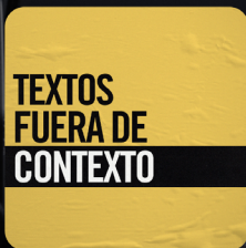
Textos Fuera de Contexto

¡ENCUÉNTRALOS EN TU PLATAFORMA FAVORITA!