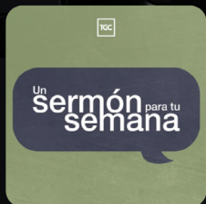
Sermón para tu Semana