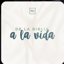
De la Biblia a la Vida