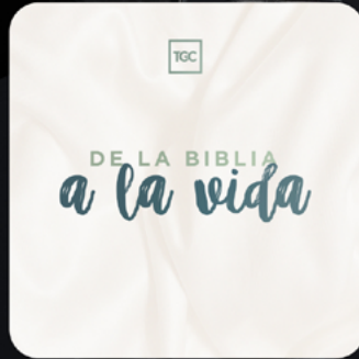
De la Biblia a la Vida