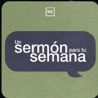
Sermón para tu Semana