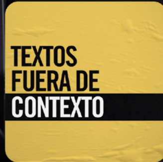
Textos Fuera de Contexto

¡ENCUÉNTRALOS EN TU PLATAFORMA FAVORITA!